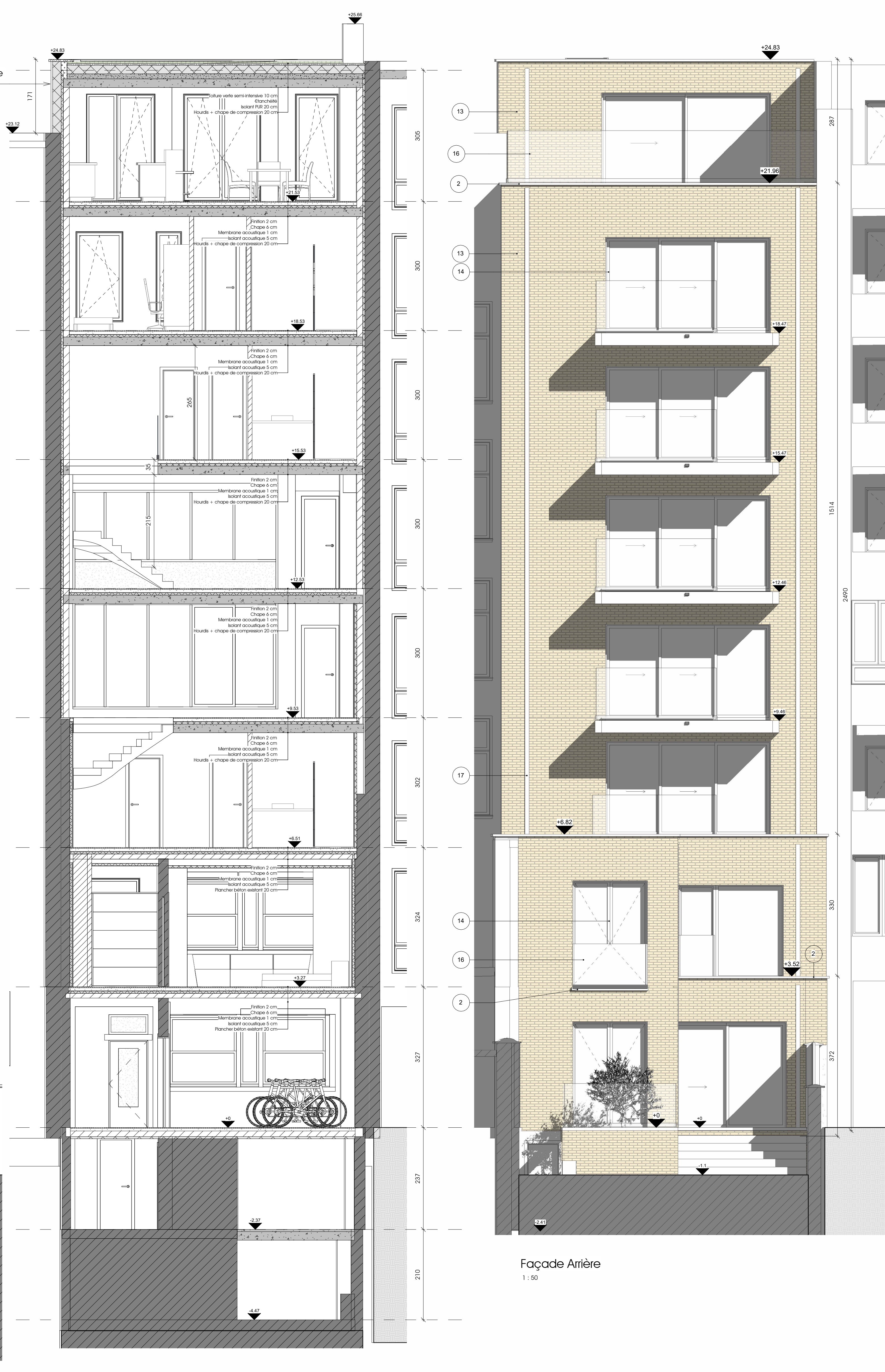
Coupe CC' 1:50