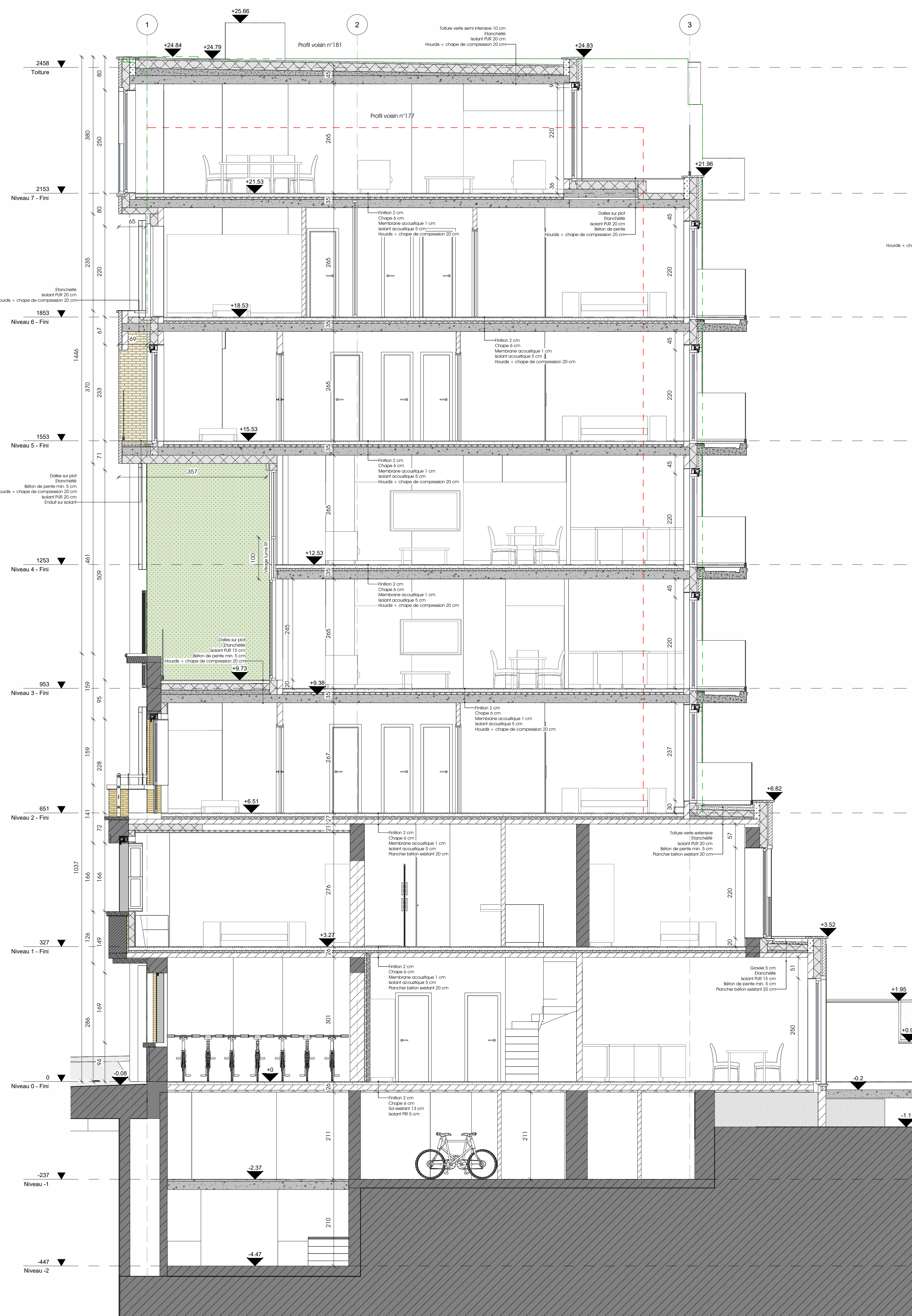
Coupe AA' 1:50